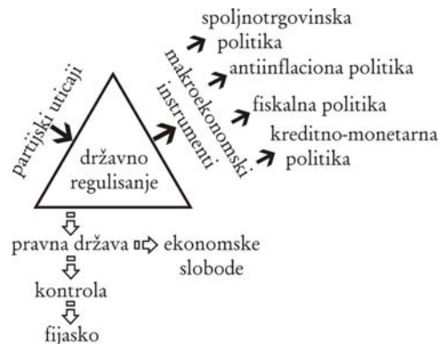
Slika 2 : Razni uticaji na državno regulisanje i osnovni neophodni makroekonomski instrumenti

Na slici 2. su prikazani različiti negativni uticaji na ekonomski institut državnog regulisanja (partijski, redukcija pravne države, izostanak kontrole, institucionalni vakuum i dr.), koji dovode do fijaska državnog regulisanja , i posledično do ograničavanja ekonomskih sloboda. Bez obzira na metodološku nekonzistentnost uopštene neoliberalne priče o tzv. „ mikro “ državi (da li se misli na socijalnu državu, što bi značilo socijalne nejednakosti, ili na pravnu državu, što bi značilo minimum vladavine prava i redukciju ekonomskih sloboda, ili na političku državu, što bi značilo minimum parlamentarizma i demokratije, ili na ekonomsku državu), ako se posmatra samo ekonomski aspekt, jasno je da uvijek i svuda mora postojati državno regulisanje makroekonomskih instrumenata, koje reprezentuju odgovarajuća četiri oblika (instrumenta) ekonomske politike.