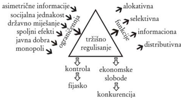
Slika 3 : Razni uticaji na tržišno regulisanje i osnovne tržišne funkcije

Na slici 4. su prikazani negativni uticaji deformisanog, neregulisanog i nekontrolisanog sistema svojine na realizaciju procesa privatizacije (koja može poprimiti grabeške karakteristike i pretvoriti se u privatizaciju ), demotivaciju ekonomskih subjekata za efikasno privređivanje, redukciju svih svojinskih funkcija, neefikasnost strukture prava svojine, gušenje i degradaciju svojinskih principa ekskluzivnosti, univerzalnosti i prenosivosti. Sve to skupa se negativno manifestuje na preraspodjelu prava svojine, odsustvo potrebne specifikacije prava svojine i njihove efikasne zakonske zaštite. Posledično dolazi do raznih i snažnih destimulativnih uticaja na funkcionisanje privrednog sistema, što značajno doprinosi njegovom kriznom stanju i ekonomskoj depresiji.