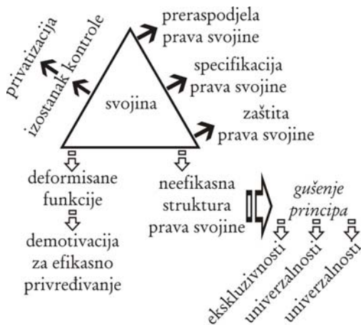
Slika 4 : Negativni uticaji nekontrolisanog sistema svojine

Na slici 4. su prikazani negativni uticaji deformisanog, neregulisanog i nekontrolisanog sistema svojine na realizaciju procesa privatizacije (koja može poprimiti grabeške karakteristike i pretvoriti se u privatizaciju ), demotivaciju ekonomskih subjekata za efikasno privređivanje, redukciju svih svojinskih funkcija, neefikasnost strukture prava svojine, gušenje i degradaciju svojinskih principa ekskluzivnosti, univerzalnosti i prenosivosti. Sve to skupa se negativno manifestuje na preraspodjelu prava svojine, odsustvo potrebne specifikacije prava svojine i njihove efikasne zakonske zaštite. Posledično dolazi do raznih i snažnih destimulativnih uticaja na funkcionisanje privrednog sistema, što značajno doprinosi njegovom kriznom stanju i ekonomskoj depresiji.