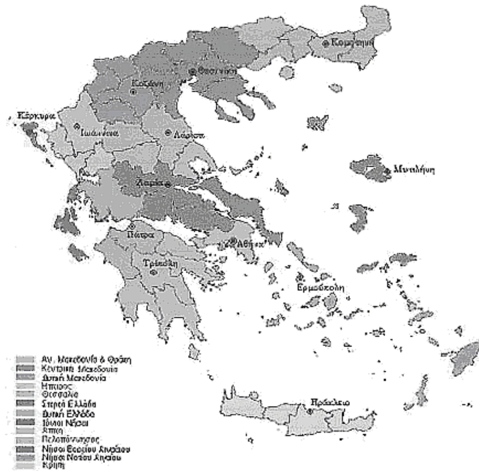
Carte 1. Régions administratives du territoire grec – Situation actuelle :

un changement de perspective au niveau des négociations au sein du conseil régional de l'Union Européenne, les propositions de restructuration se combinent, désormais vers une consolidation comprenant moins (passage de 13 à 5 ou 6) des régions administratives du pays, permettant ainsi à ces nouvelles régions d'obtenir un caractère plus dynamique, avec un tracé plus rationnel qui remplacerait les limites des régions existantes d'aujourd'hui (Carte 1), lesquelles avaient été déterminées autrefois avec d'autres critères et finalités qui cessent désormais d'être en vigueur 2 .